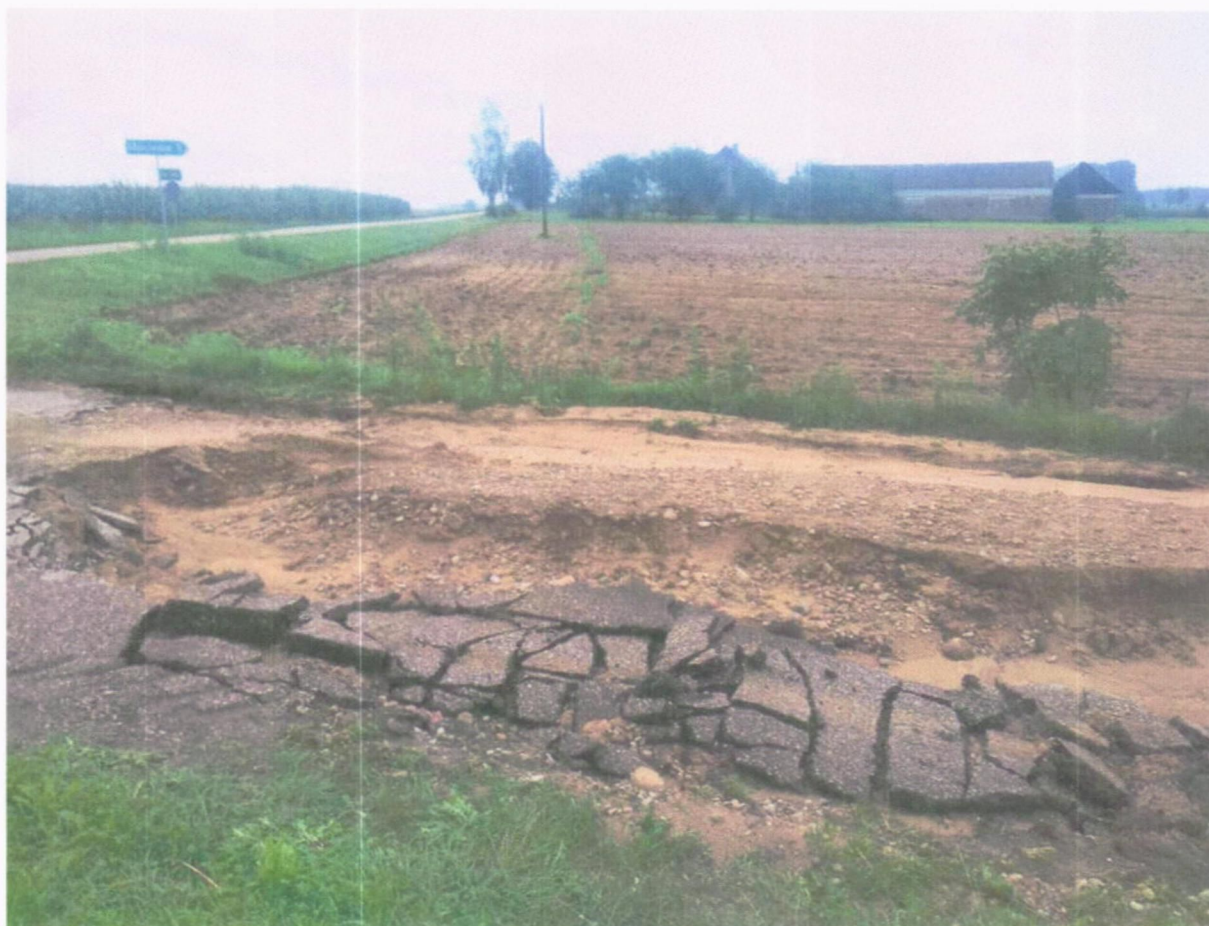
Droga z Radzi do Szacił po opadach deszczu 31 sierpień 2020