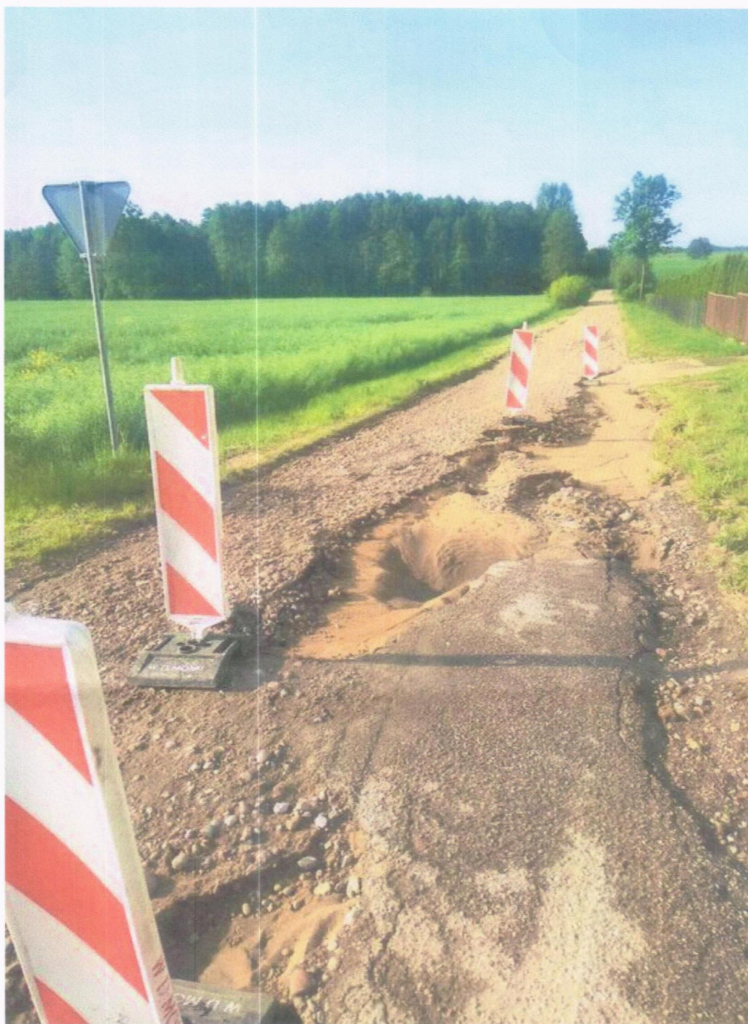
Droga z Radzi do Szacił po opadach deszczu 10 czerwiec 2020